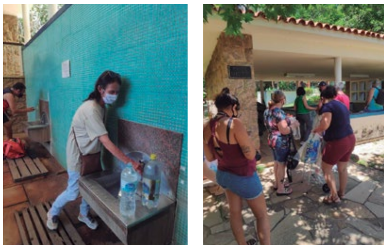
Imagem 8 e 9. Prática de coletar águas minerais no Parque das Águas de Caxambu

O Parque das Águas Lysandro Carneiro Guimarães configura-se como um lugar repleto de significados afetivos, identitários e simbólicos, onde saberes, modos de fazer e de viver se expressam em profunda interação. Mais do que atender à demanda das atividades turísticas que, desde o século XIX, são desenvolvidas no município, o Parque das Águas está diretamente vinculado à qualidade de vida e à autoestima da população de Caxambu, despertando sentimentos de identidade e pertencimento que ultrapassam a realidade material e objetiva do espaço.