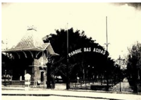
Imagens 5 e 6. Portarias do Parque das Águas em Caxambu em 1929 e 1958, respectivamente

Em 1942, o Parque de Caxambu foi retratado como “ideal”, com avenidas amplas e arborizadas, quiosques rústicos com mesas, jardins imponentes e fontes protegidas por elegantes pavilhões. O edifício do balneário ocupava a centralidade do espaço, destacado na paisagem. Contudo, a proibição do jogo no país, em 1946, teve reflexos diretos nas estâncias hidrominerais, que passaram por um período de estagnação com a queda no fluxo de turistas. Na tentativa de superar as dificuldades, novas reformas foram empreendidas no parque. No final de 1948, a antiga portaria foi substituída por outra maior e mais moderna. Além disso, a torre do relógio foi demolida em 1949 para construção de um espelho d’água, e o relógio foi transferido para a cúpula do edifício balneário.