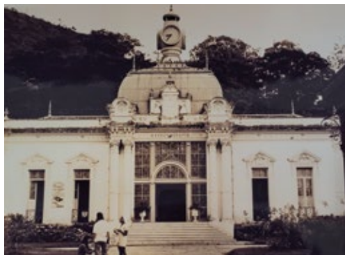
Imagem 7. Fachada do edifício Balneário no Parque das Águas de Caxambu na década de 1970

parte dos trabalhos de melhoria do local. Ainda durante a década de 1960, o Parque das Águas de Caxambu teve sua denominação modificada para Parque das Águas Lysandro Carneiro Guimarães em homenagem a um médico da cidade que atuou durante décadas no balneário. A Empresa das Águas de Caxambu foi responsável pela administração do parque até 5 de abril de 1973, quando a Hidrominas assumiu os trabalhos.