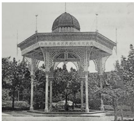
Imagens 3 e 4. Pavilhões das fontes D. Leopoldina e da Beleza, em 1936

Destacam-se também os trabalhos realizados pelo artista português Francisco da Silva Reis, conhecido como Chico Cascateiro, que esculpiu diversas obras que marcaram o paisagismo do parque. A iluminação elétrica foi inaugurada na noite de 29 de março de 1919, e as décadas de 1920 e 1930 foram de grande desenvolvimento para a região. Em 1938, foram concluídas as obras de construção de uma piscina do lado esquerdo do prédio balneário.