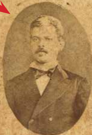
D o BIAS FORTES