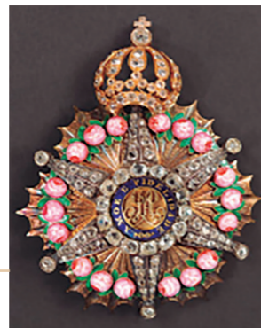
Comenda da Rosa