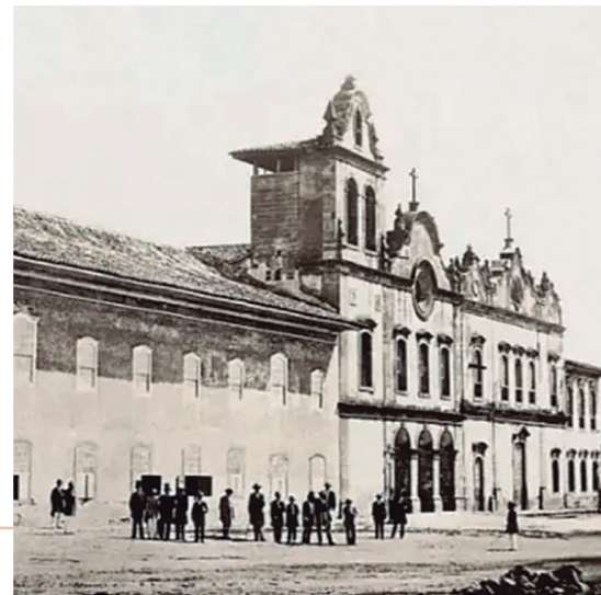
Faculdade de Direito do Largo do São Francisco - São Paulo