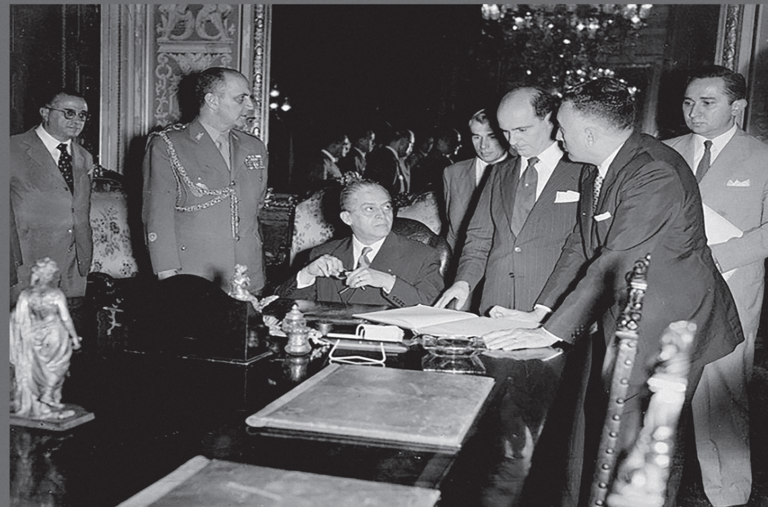
Presidente da República por três dias