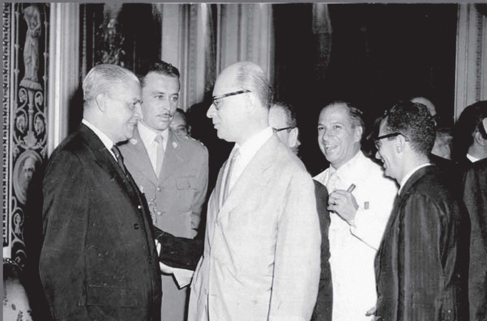
Gustavo Capanema e outros cumprimentam Carlos Luz por sua posse na presidência da República em substituição a Café Filho